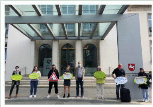
Seit dem 27. August 2020 halten Mitglieder des Personalrats und andere Beschäftigte jede Woche am Donnerstagnachmittag eine Mahnwache vor der Staatskanzlei ab.

In dieser Sonderausgabe geht es um den Austausch zwischen dem Ministerpräsidenten (MP) und dem Personalrat (PR) und um die Frage „Was kann das Land für die MHH tun?“ - eine Aufstellung der dringendsten Probleme aus Sicht der Beschäftigten, die sich der MP im März 2020 in einem Gespräch vom PR gewünscht hatte.