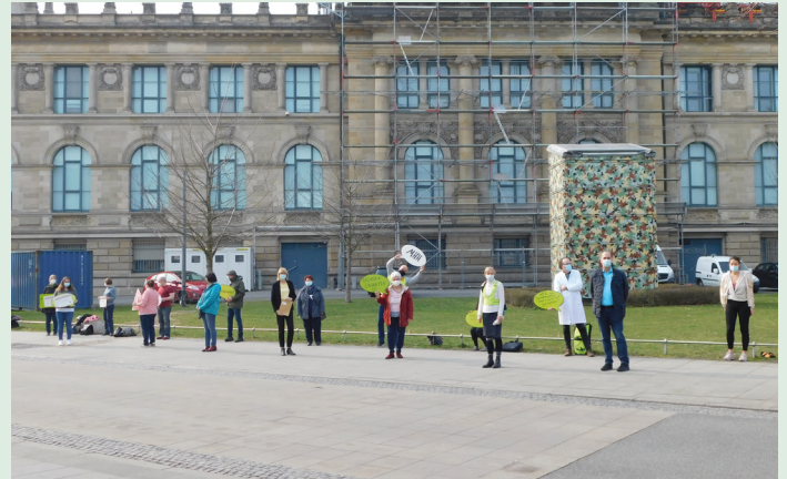
MHH-Personalratsmitglieder vor der Staatskanzlei