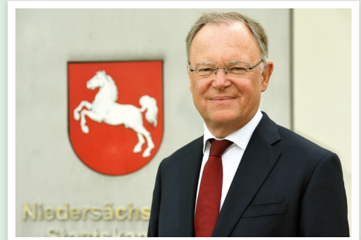
MP Weil antwortet dem Personalrat am 23. Februar 2021