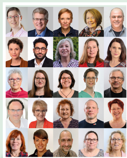
Am 7. April 2020 gehen die Handlungsaufforderungen des Personalrats an MP Weil.