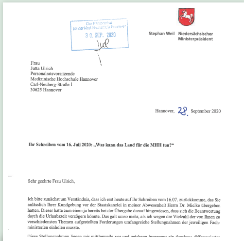
Am 28. September 2020 - nach 174 Tagen! – antwortet MP Weil dem Personalrat.