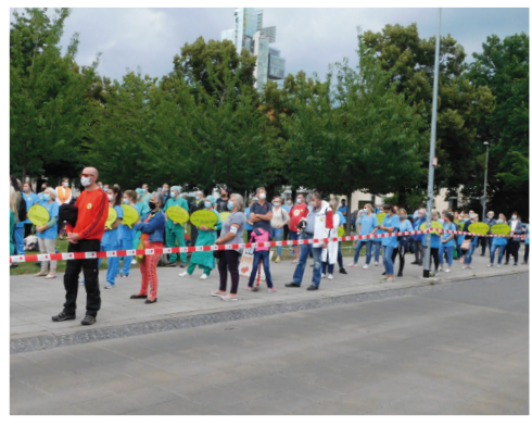
Über 200 MHH-Beschäftigte unterstützen am 16. Juli 2020 die Handlungsanforderungen des Personalrats vor der Staatskanzlei.