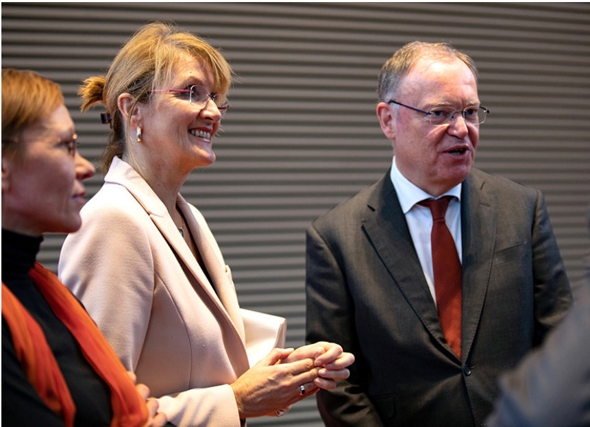
Ministerpräsident Weil auf einer MHH-Personalversammlung