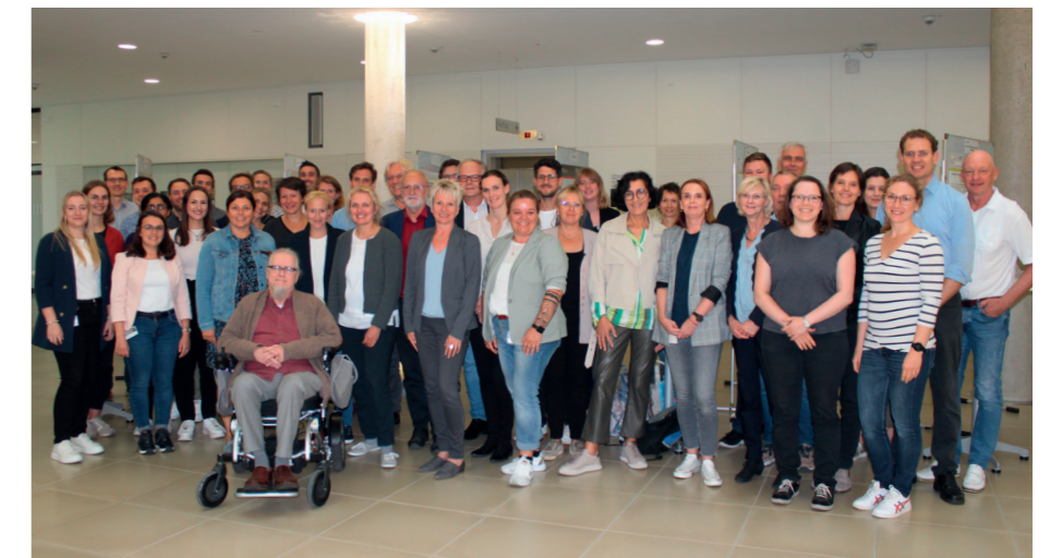
Die Teilnehmenden des CCC-N Versorgungsforschungssymposiums.

Das Symposium bot den Bereichen die Möglichkeit zum intensiveren Austausch von Ideen, des Kennenlernens der unterschiedlichen Aktivitäten und Studien sowie zur Anbahnung neuer Kooperationsmöglichkeiten. Neben Impulsvorträgen zu den verschiedenen Themengebieten und einer Posterbegehung wurde die strategische Forschungsrichtung als Onkologisches Spitzenzentrum diskutiert. Zentrale Aspekte und Fragen waren hierbei, wie sich die geographisch peripheren Bereiche in Niedersachsen besser erreichen lassen, bestehende Herausforderungen bei der Durchführung gemeinsamer Studien zusammen adressiert werden können, und wie der Weg von ‚einzelnen Inselforschungen‘ hin zu etwas ‚großem, Gemeinsamen‘ aussehen kann.