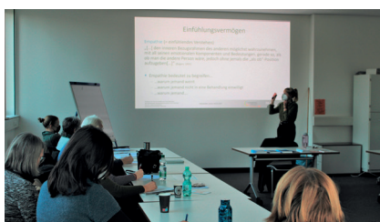
Die Teilnehmenden des Onko Helfers beim Modul "Kommunikation".

Jungen Forschenden bietet das CCC-N seit November 2022 jährlich ein eigenes Young Cancer Scientist Symposium an.