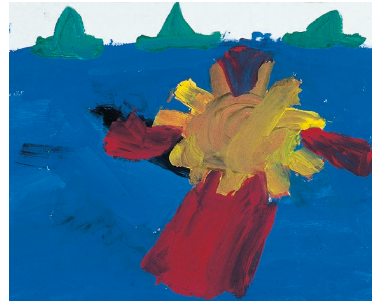
„Spiegelung des Sonnenuntergangs am Meer mit drei Segelbooten“ – Mädchen, 9 Jahre

Manchmal entsteht dadurch ein Teufelskreis der Missverständnisse. Beispielphaft wird das beim Thema Zweisamkeit deutlich: