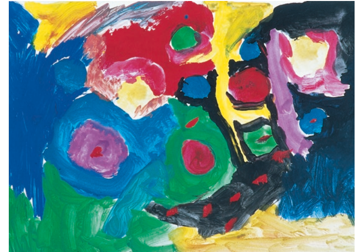
„Zellen 2“ – Mädchen, 8 Jahre

Zunächst werden die Betroffenen eine Reihe von diagnostischen Untersuchungen durchlaufen, die gut geplant werden müssen und gegebenenfalls einige Zeit in Anspruch nehmen werden. Das ist aus medizinischer Sicht vertretbar, aber der auf das Ergebnis wartende Patient muss gut begleitet werden. Nachdem die Diagnostik abgeschlossen ist, werden die Experten aus den unterschiedlichen Fachrichtungen wie Chirurgie, Strahlentherapie und innere Medizin gemeinsam in einem sogenannten Tumorboard besprechen, welche Therapieempfehlung sie aussprechen können. Dabei berücksichtigen sie sowohl aktuelle Leitlinien als auch die persönliche Situation des Kranken. Dann wird dieser