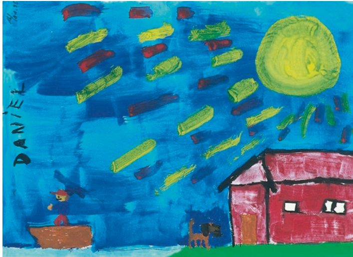
„Kleiner Mann geht mit dem Boot auf Reise“ – Junge, 8 Jahre

Der Kliniksozialdienst koordiniert die eventuell gleich anschließend zu planende Rehabilitationsmaßnahme, wenn die Primärtherapie abgeschlossen ist, oder die Entlassung nach Hause, wenn die weitere Behandlung ambulant fortgesetzt werden soll.