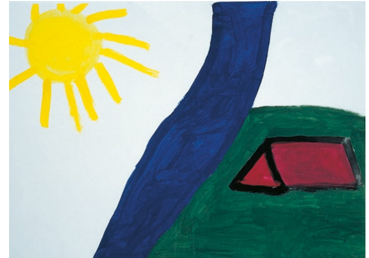
„Zelt am Fluss auf einer Wiese, links scheint die Sonne“ – Mädchen, 9 Jahre

Bei der Deutschen Krebshilfe erhalten Sie auch die Patientenleitlinie „Supportive Therapie“, die sich mit der Vorbeugung und Behandlung von Nebenwirkungen einer Krebsbehandlung beschäftigt (Bestellformular Seite 92).