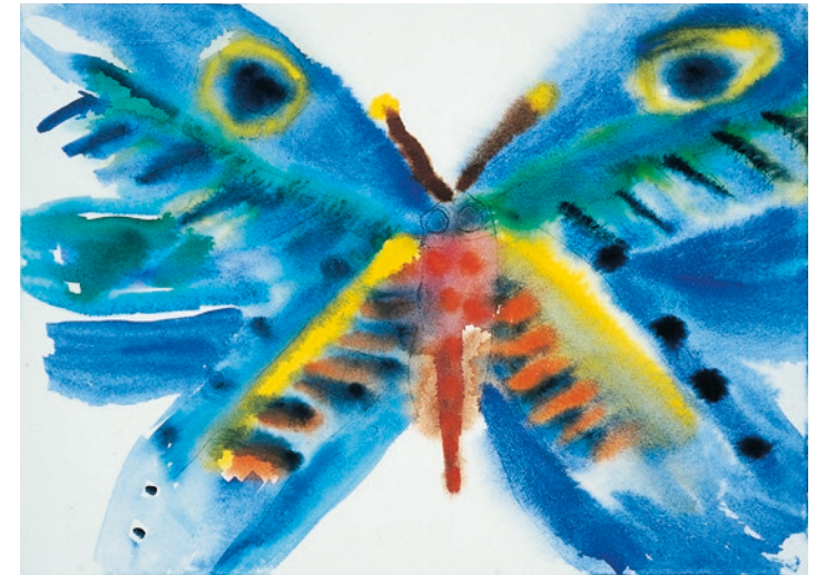
„Schmetterlinge 1“ – Mädchen, 12 Jahre

Beraten Sie gemeinsam, auf welche Weise und wie ausführlich Erzieherinnen und Lehrer mit dem Kind über die Krankheit reden. Den Pädagogen kommt hauptsächlich die Beobachter- und Zu-