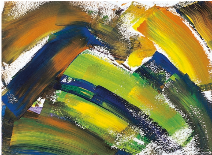
„Der zerbrochene Regenbogen“ – Mädchen, 14 Jahre

in den Jahren zuvor. In jedem Fall will er helfen, weiß nur nicht genau wie. Das kennen Sie auch von sich selbst.