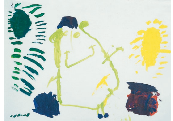
„Ein Männchen steht zwischen einer gelben und schwarzen Sonne, es hat ein Paar Zauberschuhe, mit denen es in ein Märchenland laufen kann“ – Mädchen, 3 Jahre

Fragen Sie Ihren Angehörigen nach seinen Ratschlägen und Erfahrungen. Ein Krebskranker mag körperlich nicht mehr so