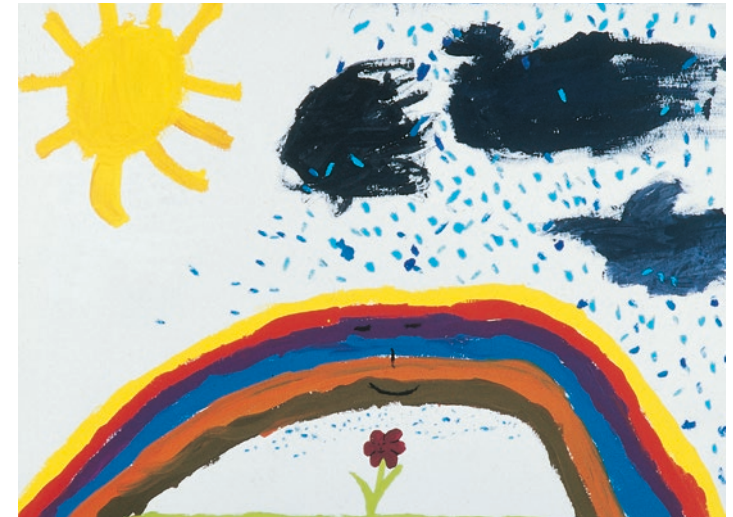
„Der Regenbogen beschützt die kleine Blume, Gewitterwolken ziehen von links nach rechts vorüber“ – Mädchen, 11 Jahre

Ist Krebs ansteckend? Kann Papa sterben, während ich in der Schule bin? Was macht der Krebs mit Mama? Wird Papa noch kränker werden, wenn ich Lärm mache? Werden mich meine Klassenkameraden auslachen, weil meine Mutter keine Haare hat? Das ist nur eine Auswahl von Fragen, die sich Kinder stellen, wenn Sie von der Krankheit und deren Therapie erfahren.