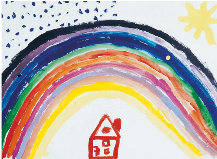
„Kleines Haus unterm Regenbogen“ – Junge, 8 Jahre

ständen haben Sie Angst davor, dass Sie zur Last fallen könnten, oder es ist Ihnen unangenehm, dass Sie so unsicher oder hilflos sind. Möglicherweise fühlen Sie sich auch unbehaglich, dass Sie für sich selbst um Unterstützung bitten möchten, wenn sich die Familie und die Freunde immer nach dem Kranken erkundigen.