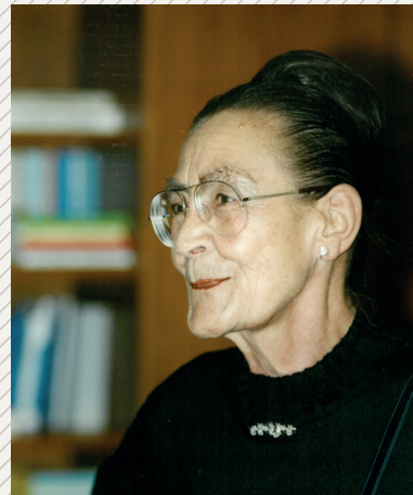
Foto: Namensgeberin – Professorin Dr. med. Ellen Schmidt.

Internet: www.mhh.de/gleichstellung/programme-und-projekte/ellen-schmidt-programm