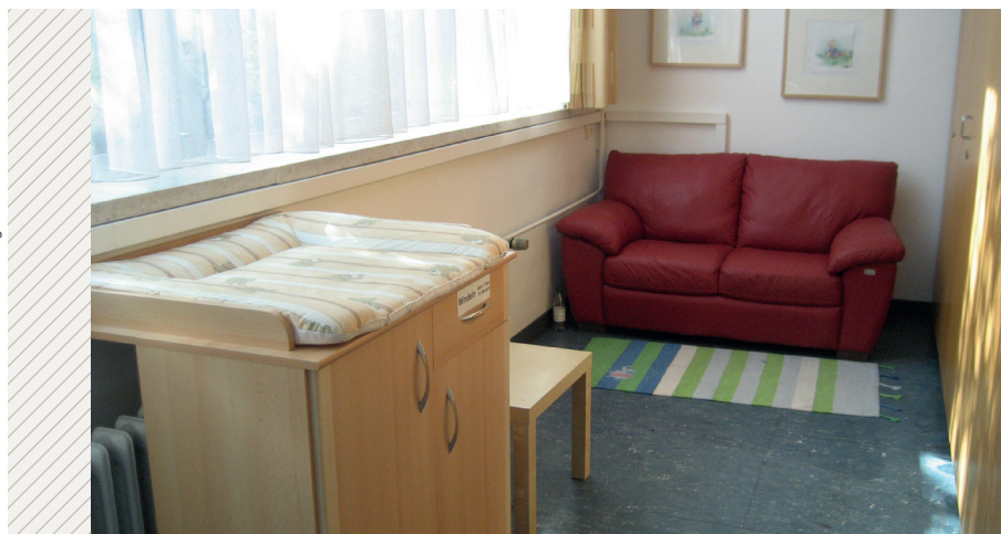
Foto: Still- und Wickelraum, Gleichstellungsbüro MHH

Öffnungszeiten: Montag - Freitag von 08:00 bis 19:00 Uhr