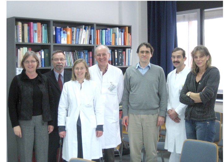
Gründungsitzung des Kompetenzzentrums 2009