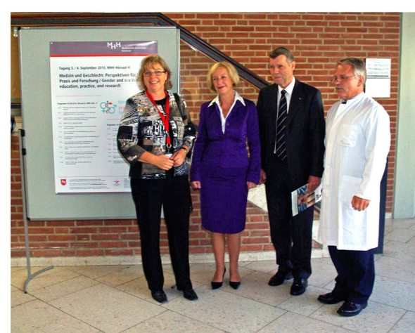
Tagung „Medizin und Geschlecht“ 2010

Treffen der MHH-Projektleitungen von „Geschlecht – Macht – Wissen in der Transplantation“ 2016